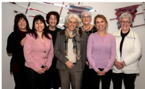
Les 7 mairesses de la MRC de Kamouraska, présidentes d'honneur du tournoi de golf 2022