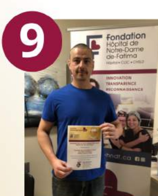
Syndicat des travailleurs de la Tourbières Lambert