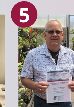
Centre jardin Montminy