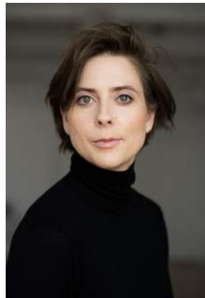
Eve Landry, présidente d'honneur

Sous la présidence d'honneur de Mme Eve Landry, comédienne québécoise et native de Saint-Pascal-de-Kamouraska, la Fondation fêtera son quarantième anniversaire en grand dans le cadre d'un Gala honorifique qui aura lieu le samedi 21 octobre 2023, au Collège de Sainte-Anne-de-la-Pocatière. Pour l'occasion, un cocktail et un souper haut en saveurs, qui regrouperont des épicuriens de tous les milieux de la région du Kamouraska et des environs, seront servis dans le cadre d'une formule 5 services aux tables et de 3 stations en formule banquet.